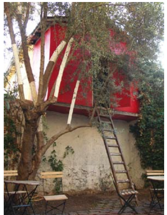
Le jardin (35 m 2 ) et la cabane (5m 2 )