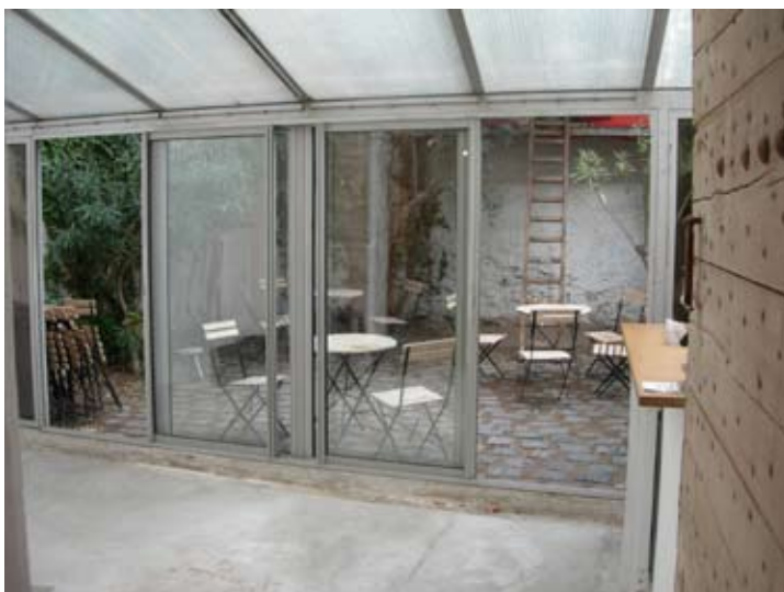
Véranda : 25m 2