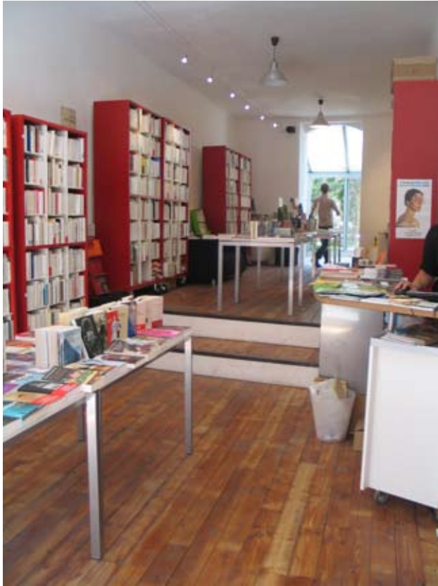
La librairie : 55 m 2