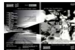
La fission de l'atome